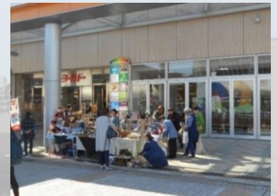
バザーのイメージ