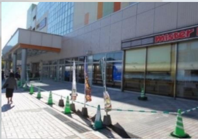
利用可能スペース

ご興味がある方や地域の活動団体におかれては、お気軽に下記連絡先までご連絡・ご相談ください。