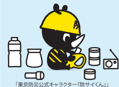
「東京防災公式キャラクター「防サイくん」」

9月は台風のシーズンでもあり、近年はゲリラ豪雨による被害も増えています。「防災の日」を機会に、あなたの防災の備えを点検してみてはいかがでしょうか？