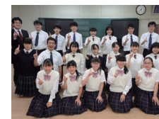
帝京八王子吹奏楽部

【日程】9/5(土)・12(土)・26(土)・27(日) 【時間】15:00～ 【場所】B街区 フェスティバルステージ